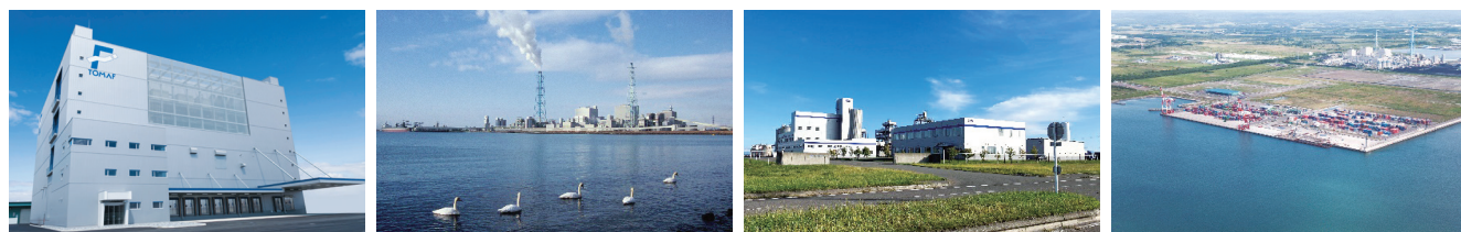
苫小牧埠頭(株) 北海道電力(株)苫東厚真発電所 オエングループ 合同酒醸(株)苫小牧工場 苫小牧国際コンテナターミナル

大型船(10万tクラス)の入出港が可能な水域と平坦で広大な後背地があり、火力発電所や物流施設などが立地しています。国際コンテナターミナルや国内フェリー航路が開通されているほか、今後、道内最大級の温度管理型冷凍冷蔵倉庫を中心とした食関連産業等の国際物流拠点としても期待されています。