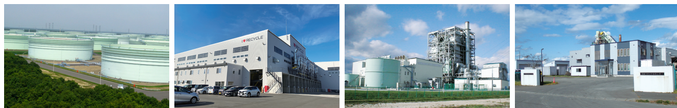
苫東石油備蓄(株) (株)マテック (株)サニックスエナジー 空知興産(株)

大規模な石油備蓄基地が立地しています。また、循環産業拠点構想に基づく基盤整備により、リサイクル関連産業の集積が進んでおり、環境・エネルギー関連産業などに適している地区です。