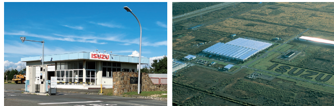
いすゞエンジン製造北海道(株) いすゞエンジン製造北海道(株)

日高自動車道、国道235号線、道道上厚真苫小牧線に囲まれた好適地に、自動車関連産業と研究施設が立地しています。