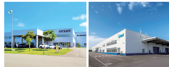
アイシン北海道(株)

苫東地域の丘陵地に位置し、新千歳空港ターミナルから車で20分。自動車関連産業をはじめとする製造業、食関連産業、エネルギー関連産業、物流関連産業、リサイクル関連産業など様々な企業が立地。生産・研究施設等リスク分散の最適地でもあります。